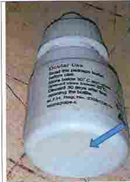
يوجد خط في أسفل الزجاجية