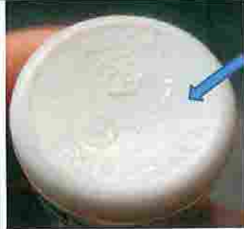
لا يوجد خط في اسفل الزجاجية.