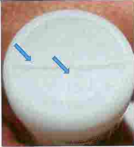
يوجد خط في أسفل الزجاجاة