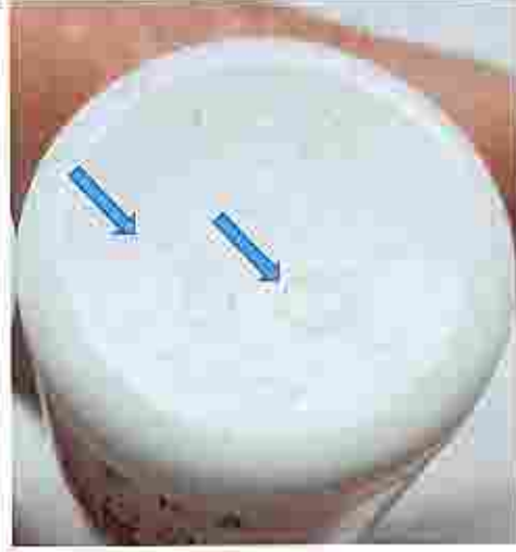
لا يوجد خط في أسفل الزجاجاة