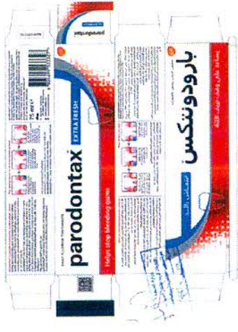
بارودونتكس انتعاش زائد 75 ملل.