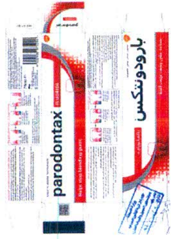
بارودونتكس بالفلوريد 75 ملل.